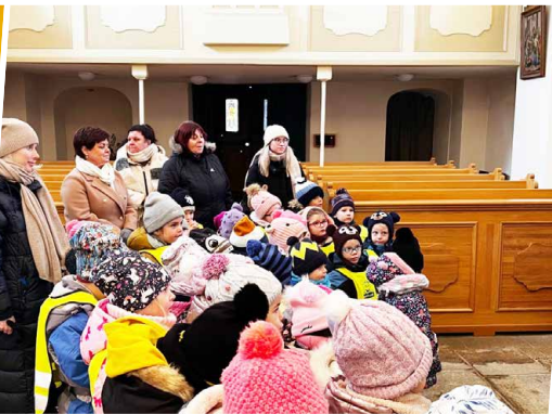
Zima v mateřské škole